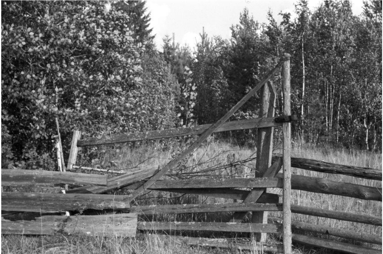
Õuevärav Murksi külas. 1964. EVM N 98:27.

Riin Alatalu, PhD Ajakool OÜ Tegevusluba nr VS/312/2007-E EMU000156